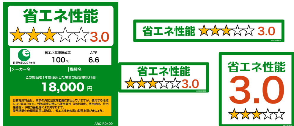
(家庭用エアコンディショナーのイメージ)