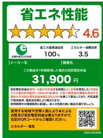
(電気温水機器のイメージ)

※温水機器以外は、製品のサイズやネット取引等の限られたスペースで使用する場合は右側のミニラベルを活用すること。